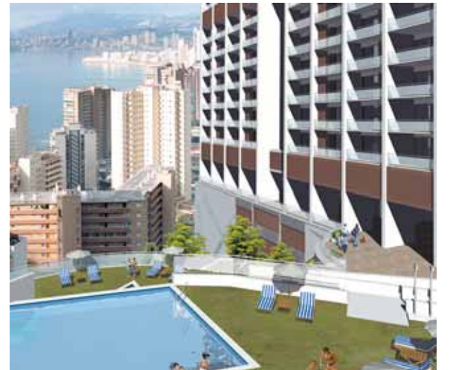
Vista interior de la urbanización, con el jardín y la piscina.