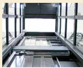
El ascensor ya no usa cables.

viabilidad, (2) del proyecto técnico de la obra, firmado por un arquitecto y (3) de la licencia del ayuntamiento para realizar dicha obra civil. No se encarga de las subvenciones, aunque sí dan información sobre ellas.