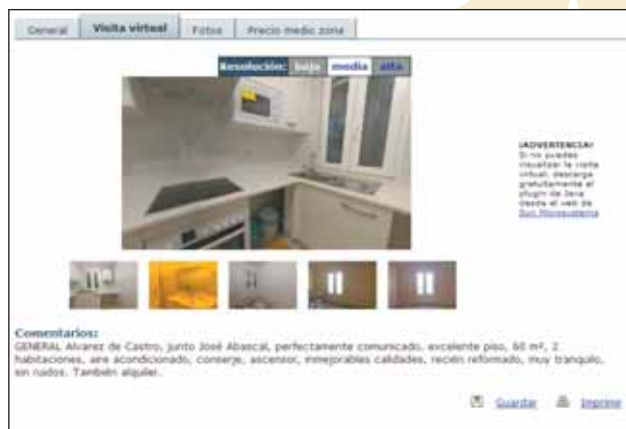
Con las 'visitas virtuales' se recorre la casa desde todos los ángulos.

Un paseo por el ciberespacio ahorra horas de visitas a pisos que pueden decepcionarnos. "Gracias a las fotos podemos descartar los pisos que no nos interesan, y hacer una mejor selección". El uso de internet ha reducido el número de visitas a 4,3 casas por persona