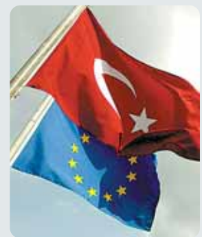
La UE y Turquía, de la mano.

El precio de una casa de 100 m 2 en la capital, Ankara, o Estambul (capital económica) oscila entre 80.000€ y 155.000€. El precio se dispara en zonas de costa, como Antalya.