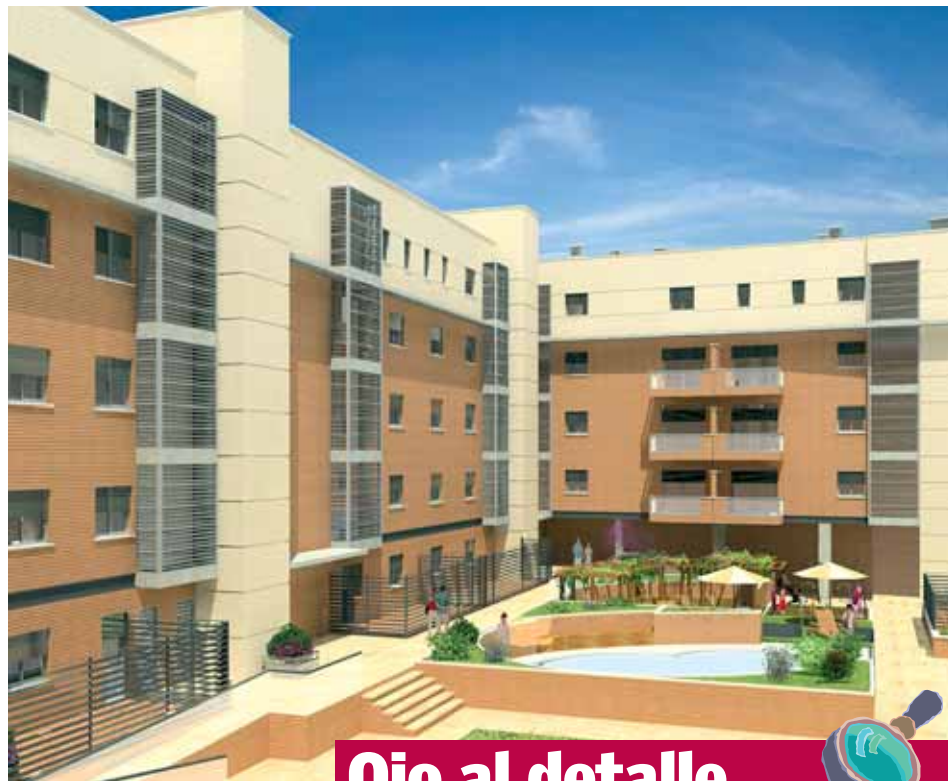
Interior de la urbanización.

En la principal arteria del barrio de Villaverde Alto se halla el conjunto residencial Parque Real, una urbanización que cumple con los requisitos para convertirse en opción de compra preferente para familias jóvenes. Tanto la situación como las características de las viviendas responden a lo que necesita un hogar que puede crecer. El acceso por carretera, mediante la salida 24 de la M-40 y varias líneas de autobuses, y la cercanía