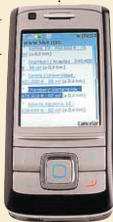
Una búsqueda a través del móvil.

Idealista.com incorpora también alertas por SMS (a 0,20€ cada uno), con la casa que mejor se ajusta a las necesidades del usuario. Se reciben en el mismo momento en que se inscribe la vivienda.