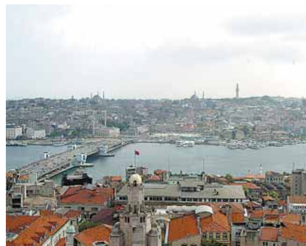
Vista panorámica de la ciudad de Estambul.