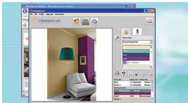
Imagen de Colorplanner, con el que cambias el color de toda la casa.

ción", aseguran en Fotocasa.es. Por si fuera poco, cada vez más webs ofrecen las llamadas 'visitas virtuales': imágenes de 360º de cada habitación con las que se puede ver cada rincón de la vivienda sin salir de casa. Aún así, "todavía nos gusta tocar lo que vamos a comprar" explican los expertos.